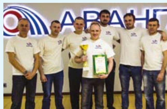
Волейбольная команда АО «Авангард», занявшая первое место в первенстве коллективов физической культуры Сафоновского района по волейболу среди мужчин