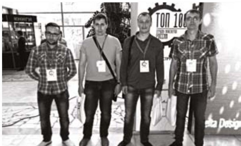
Участники финала конкурса — работники АО «Авангард»

В Ульяновске завершился Всероссийский конкурс «ТОП 100 лучших инженеров России», который занима-