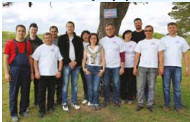
Экологическая акция «Чистый берег». Работники АО «Авангард» и представители Индустриального парка «Сафонов» на берегу реки Днепр