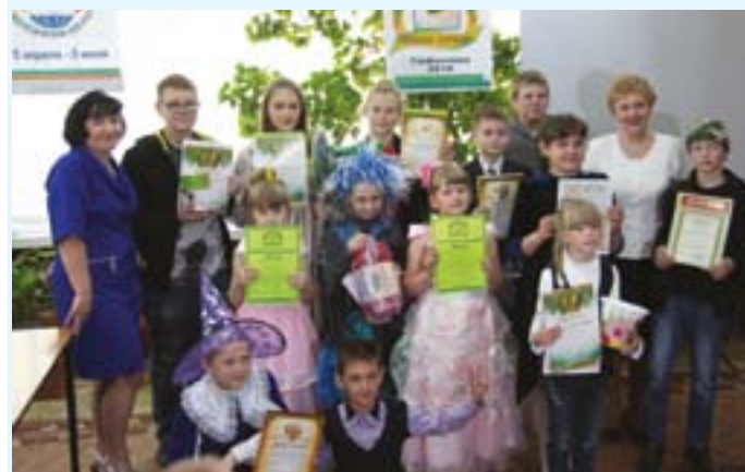
Награждение победителей 14-го районного экологического фестиваля «Познавая, сохраняй!». АО «Авангард» – генеральный спонсор, входящий в состав жюри мероприятия