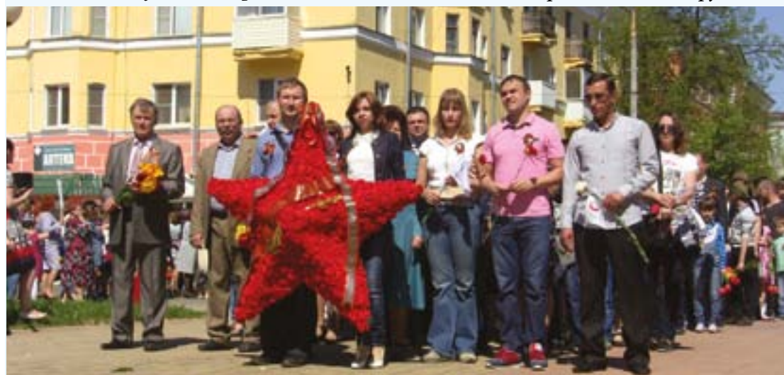
Делегация АО «Авангард» на митинге, посвященном Дню Победы. В этот день представители предприятия возложили венки к братским могилам в деревне Какушкино Сафоновского района и к памятному знаку на территории Сафоновского индустриально-технологического колледжа