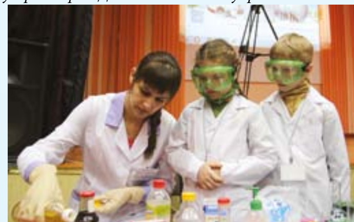
Первые химические опыты. Представители Совета молодых работников АО «Авангард» во время проведения коллективно-творческого дела по наукам среди учащихся начальных классов МБОУ «СОШ №8»