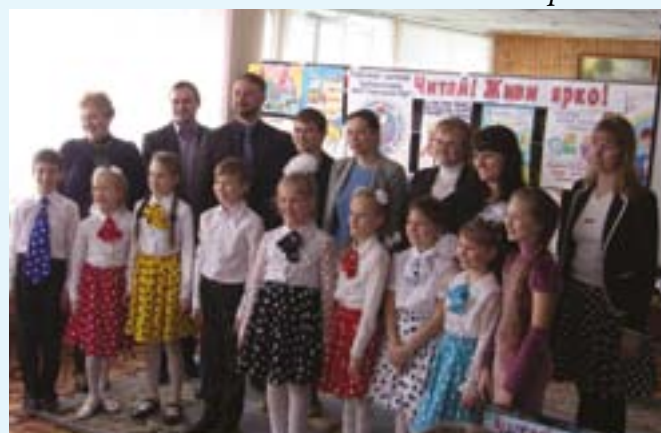
Представители АО «Авангард» на финальном мероприятии награждения победителей ежегодного литературного конкурса «Лидеры чтения 2016»