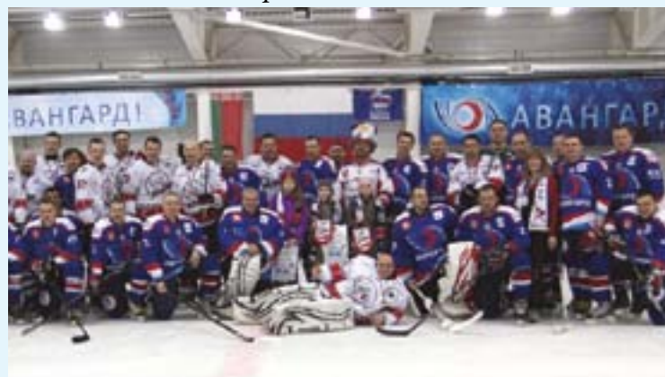
Спортивный праздник от АО «Авангард». ХК «Авангард» и команда артистов «КомАр» из Москвы в физкультурно-оздоровительном комплексе «Сафоново Спорт-Арена»