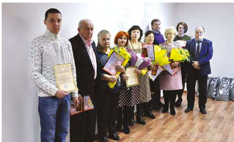
Сотрудники предприятия, награжденные по итогам года

Почетной грамотой АО «Авангард» награждены: мастер электромонтажного