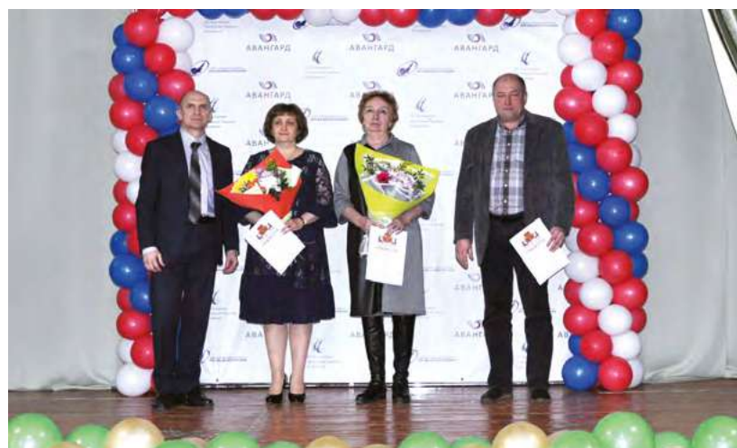
Награжденные Почетной грамотой АО «КТРВ» в связи с юбилейной датой со дня рождения