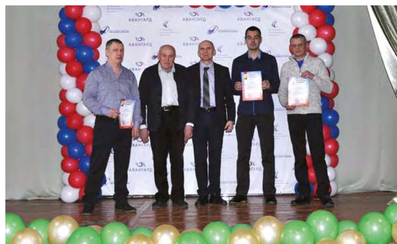
Лучшие работники предприятия, награжденные в честь Дня защитника Отечества

За добросовестный, безупречный труд, личный вклад в производство объ-