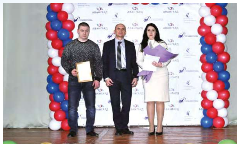
Награждение Почетной грамотой Министерства промышленности и торговли РФ

За многолетний добросовестный труд, большой личный вклад в развитие промышленности Почетной