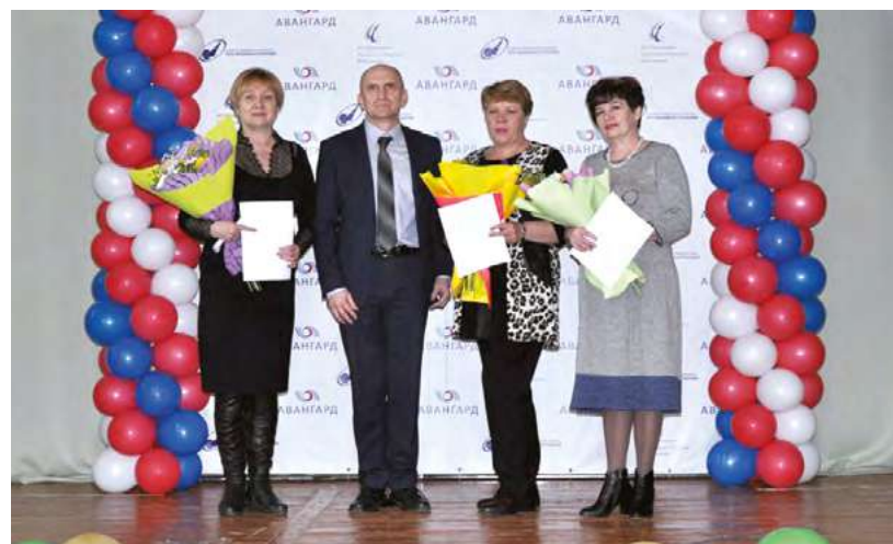
Награжденные Почетной грамотой предприятия