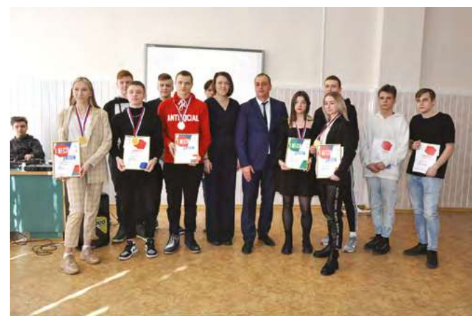
Победители и призеры компетенций «Технологии композитов» и «Проектирование и изготовление пресс-форм»