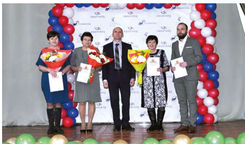
Награжденные Почетной грамотой АО «КТРВ» в связи с 20-летием со дня образования Корпорации