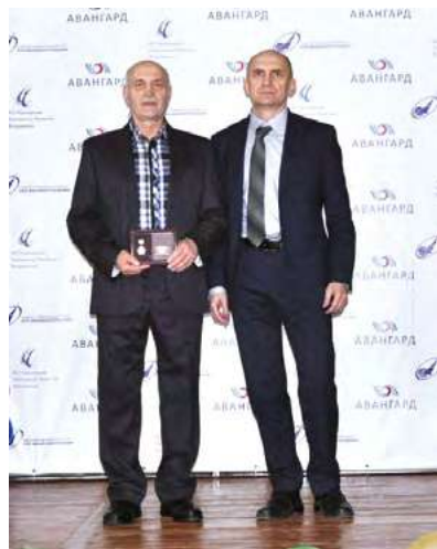
Чествование Почётного машиностроителя РФ